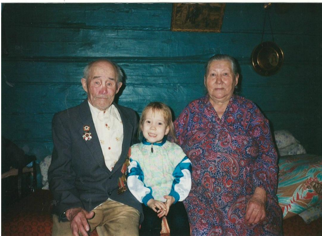
Фото 1. Встреча с прабабушкой и прадедушкой в 2002 году

6 июль 45 г. Ночевка в окрестности Берлина. Находил письмо одной девушки фронтовику, у меня выразились воспоминания о своей жизни, об учебе и о любимой девушке и т.п. И о несчастной бездольной своей судьбе. Зачем этот плен, эти нечеловеческие мучения, страдания. Сколько жизни, взял этот плен от русских людей и т.д.