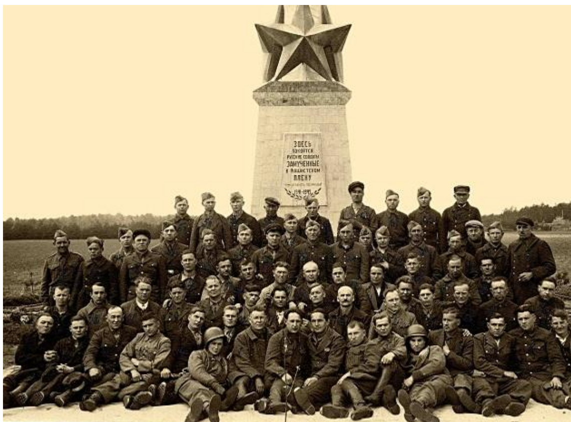
Фото 4. Строители памятника