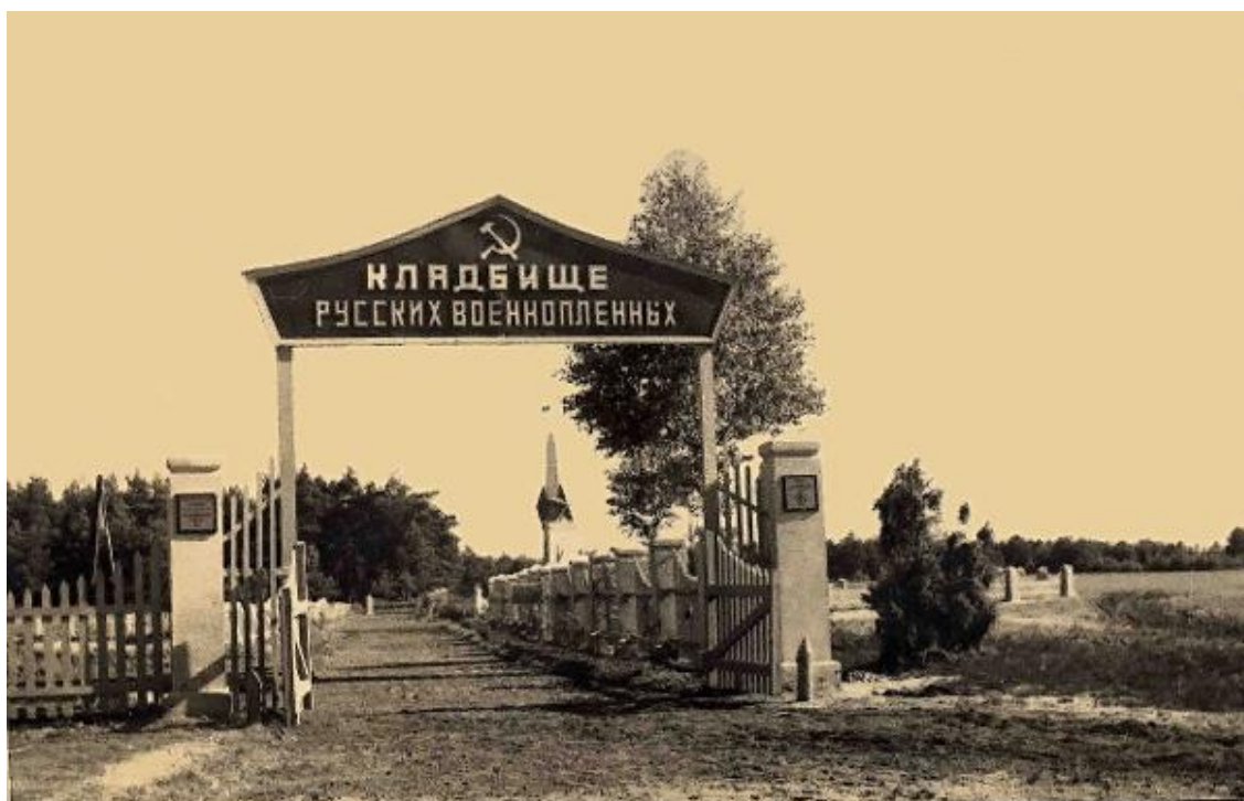
Фото 3. Кладбище в Штукенброке