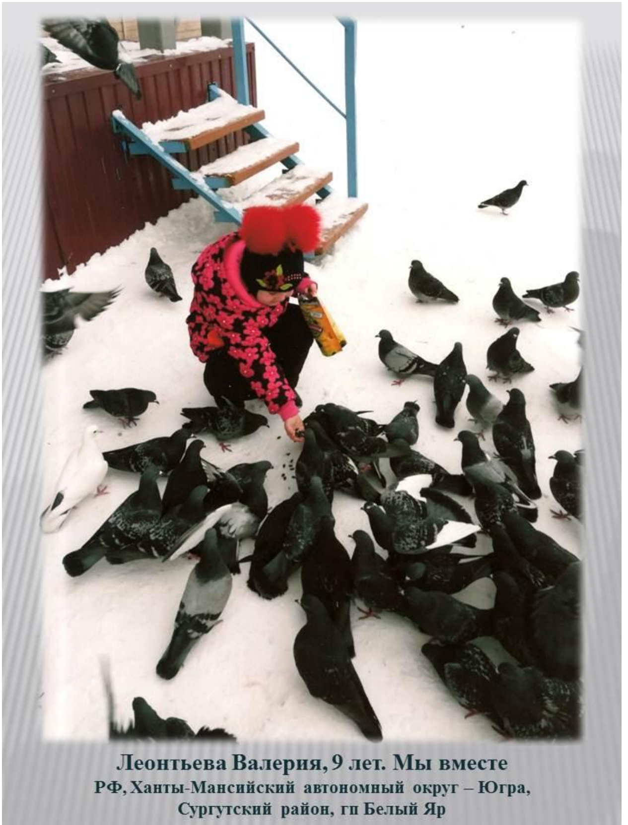
Леонтьева Валерия, 9 лет. Мы вместе РФ, Ханты-Мансийский автономный округ – Югра, Сургутский район, гп Белый Яр