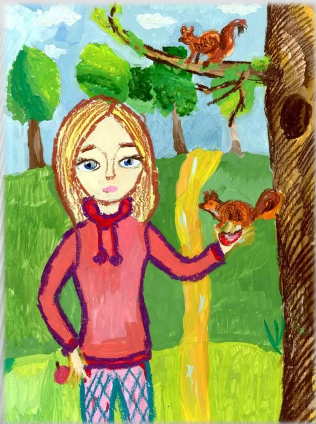
Селезнева Алиса, 10 лет. Я кормлю белок РФ, Вологодская область, г. Вологда